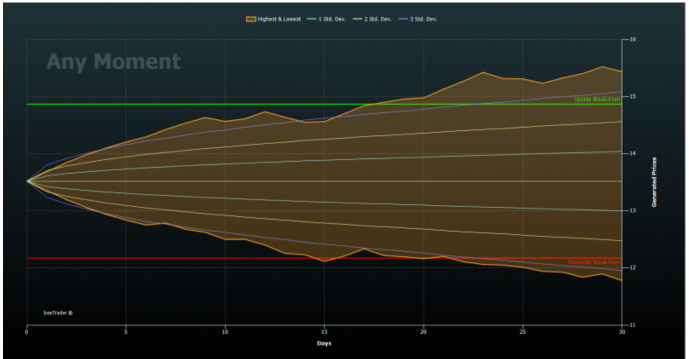
Grafico Any Moment

In questo grafico, invece, viene indicato il massimo ed il minimo per ogni giorno della simulazione, e non solo alla scadenza della stessa, in questo modo si ha la percezione dello scostamento durante la vita della simulazione.