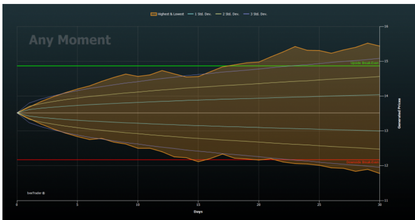
Grafico Any Moment

Questo grafico genera le percentuali mostrate nel box At Expiry.